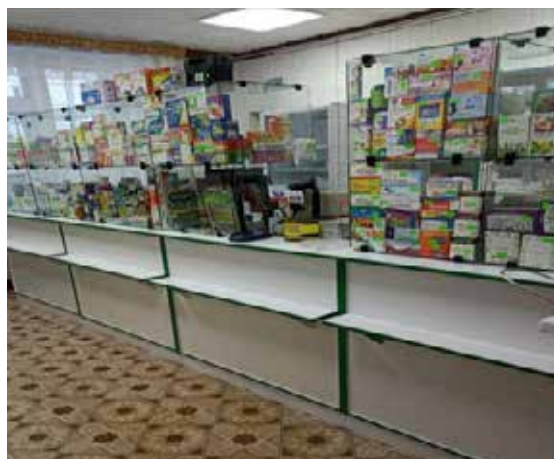
Рисунок 8. – Торговый зал аптеки № 198 четвертой категории аг. Пески

Для улучшения материально-технической базы в 1997 году аптека переведена в здание Песковской врачебной амбулатории. Функционирование аптеки позволило качественно улучшить лекарственное обеспечение жителей, объединив его с медицинским обслуживанием (рисунок 8).