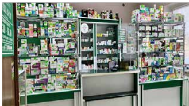
Рисунок 9. – Аптека № 242 четвертой категории аг. Первомайская

го района, фармацевтические работники выполняют социальную функцию по обеспечению населения лекарственными средствами, медицинскими изделиями и другими товарами аптечного ассортимента, продолжая славную трудовую летопись аптечной службы Берёзовщины.