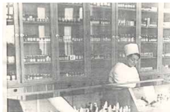
торговый зал старого здания