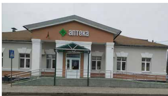
здание после ремонта

жении многих лет в аптеке проводились ремонтные работы с заменой окон, дверей, оборудованием санузла, заменой торгового оборудования. В 2006 году приобретен автомобиль для доставки товара в аптеки района. В 2010–2011 годах в ЦРА № 18 проведен капитальный ремонт. Современный облик приобрели не только фасад, крыльцо, внутренние помещения аптеки, но и прилегающая территория. Особенно преобразился торговый зал – осуществлена перепланировка торгового зала, так как большой ассортимент товаров и поток посетителей требовали его расширения. Здесь было установлено новое оборудование с учетом увеличения витринного пространства и количества рабочих мест специалистов, занятых обслуживанием посетителей [6] (рисунок 3).