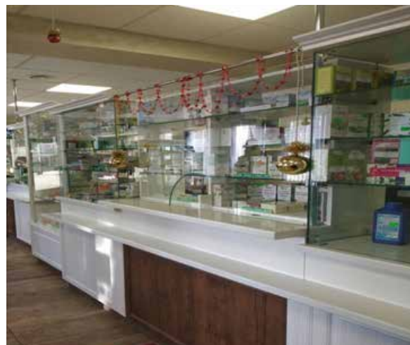
Рисунок 4. – Внешний вид здания и торгового зала аптеки № 111 г. Белоозёрска

Типовое здание аптеки соответствует всем нормативным требованиям, в нем созданы условия для выполнения аптекой функций по оказанию лекарственной помощи населению. С 2016 по 2017 год в здании аптеки были проведены ремонтные работы: заменена кровля, окрашен фасад, заменено торговое оборудование.