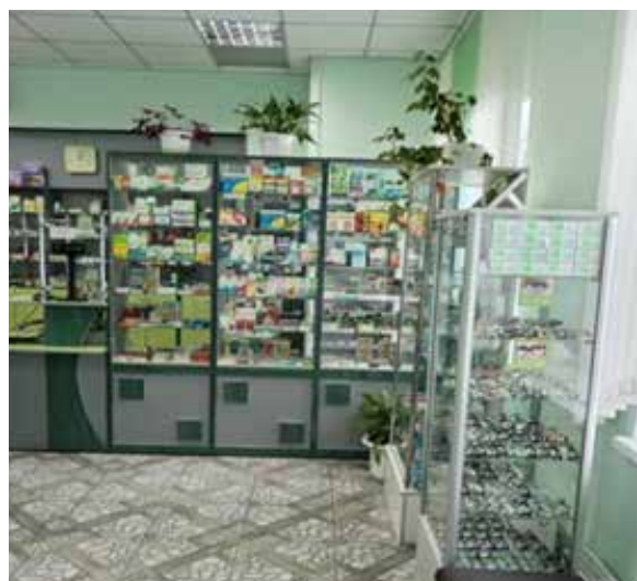
в наши дни