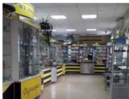
торговый зал после ремонта