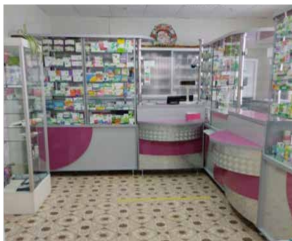
Рисунок 7. – Торговый зал аптеки № 23 аг. Маревиль

В 2014 году в аптеке проведена перепланировка торгового зала с установкой нового оборудования, что позволило увеличить витринное пространство (рисунок 7).